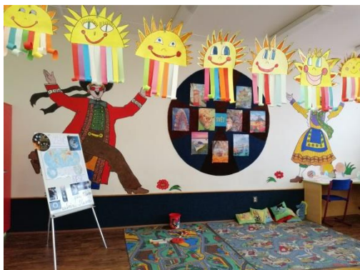
Opere ale micilor artiști!

Școala arată ca o carte de povești: totul este curat, flori pretutindeni, toată școala este o expoziție în care elevii și-au exprimat creativitatea și ingeniozitatea în lucrări care pot fi comparate cu adevărate opere de artă.