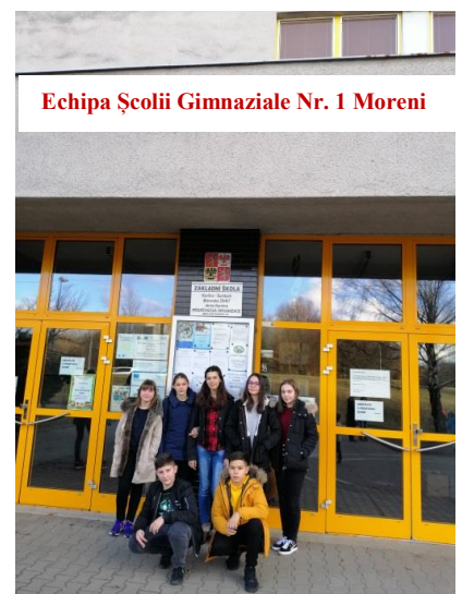
Echipa Școlii Gimnaziale Nr. 1 Moreni