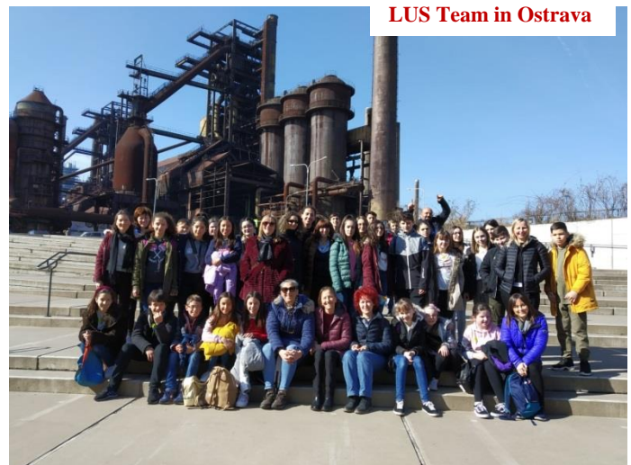
LUS Team in Ostrava